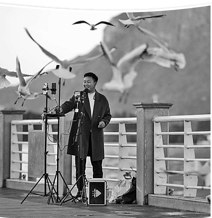
在昆明海埂大坝上,网络主播直播城市的美丽风光。

们的日常工作”的认可。除了“老三样”,一些行业剧还将镜头聚焦飞行员、房产中介、工程造价师等此前较少涉及的职业和行业领域。比如,2022年,哔哩哔哩(B站)自制网剧《三悦有了新工作》,以一位95后女性遗体化妆师的独特视角,带领观众走近殡仪馆的日常工作。近年来,有关殡葬题材的影视作品逐渐受到关注。2022年,电影《人生大事》从职业关怀的角度刻画了殡葬从业者的日常。而《三悦有了新工作》则以电视剧的形式,展现和探讨“死亡”这个话题,并触及亲子关系、互助式养老、阿尔兹海默症、网络交友诈骗等社会热点话题。《三悦有了新工作》是B站第三部自制网剧,与其前两部自制剧《风犬少年的天空》《突如其来的假期》一样,受众定位同样清晰,直指主要用户群体——“网生代”青年。