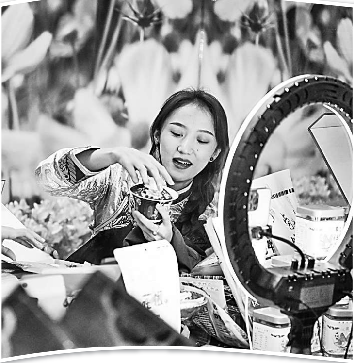
在国家会展中心(天津),参会人员直播推介瓷器等非遗艺术品。

经济”拉动,但文化直播把“带货”的过程融入故事中,浸入情境中,更能与观众产生共情。从“人设”带货,到文化“创”货,不仅是营销手段另辟蹊径,更是价值传播的“升维”。越来越多的消费者,不再满足于“买买买”的物质消费,而是谈论起什么是“腹有诗书气自华”。不只是一斗米、一簞饭来填饱肚子,也需要知道麦穗是怎么从大地上生长出来的。这样一来,直播间就不仅有低价,更有了文化和情怀。